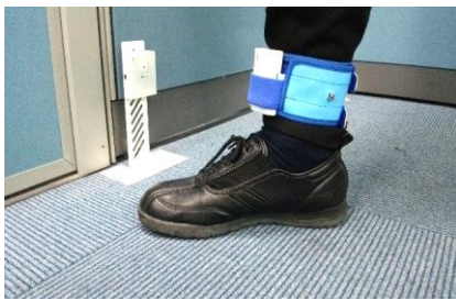
足首センサーを装着