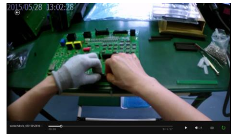
作業者の手元をしっかりと撮影、技能伝承にも