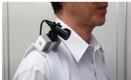
肩に小型ビデオカメラを装着